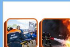
Профиград – Игра "Профессии в сфере безопасности"