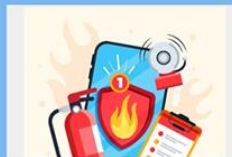
Профиград – Тест "Порядок действий при пожаре"