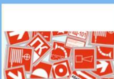
Профиград – Квест "Найди выход"