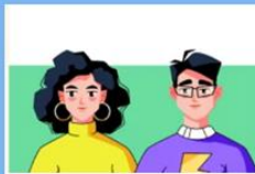
Профиград – Тест "Проверь себя"