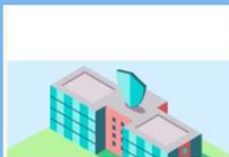
Профиград – Тест "Безопасность в интернете"